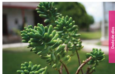
Dedo de dios

Se inicia en Estación Catorce y se interna en la vasta serranía de Catorce. En Tahonas del Jordán podemos observar de forma silvestre la hierba del burro que se utiliza para el empacho, o bien, la calabacilla loca que sirve para blanquear la ropa, pero que también asociada a la